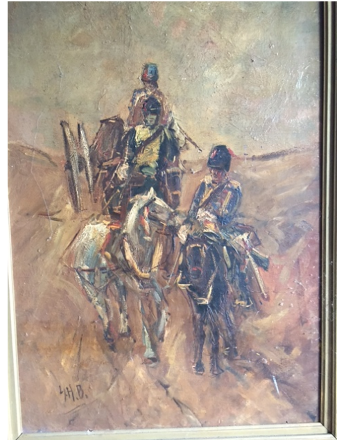
Artillerietrein Rijdende Artillerie

Een bijzondere schenking is het schilderij "Artillerietrein Rijdende Artillerie". Geschonken door Jhr drs H.A.N. de Brauw. De initialen G.H.B. op het schilderij deden vermoeden dat het om een Breitner ging. Zeer waarschijnlijk is dat niet zomaar misschien gaat het om een studie van Breitner. Dit wordt nader onderzocht. Vanwege de bijzondere voorstelling is toch gekozen voor een restauratie van het schilderij. Het zal naar verwachting tijdens het Korpsdiner 2018 getoond kunnen worden.