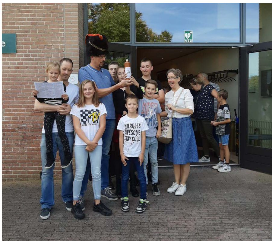
Open Monumentendag 2019