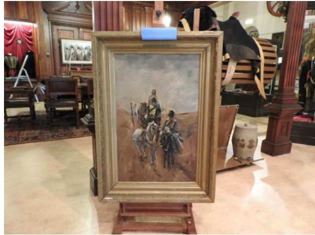
Schilderij "De Artillerietrein"