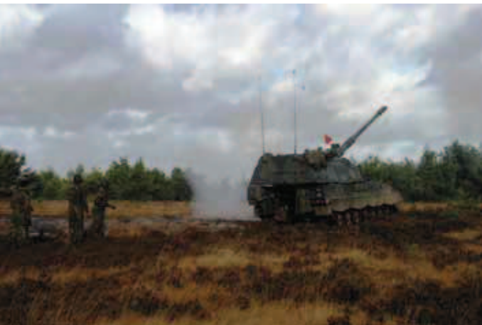
Het eerste schot wordt afgevuurd met het lange afvuurkoord